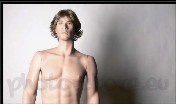
Svícení hlavním světlem v úhlu 35° za pomoci velkého softboxu