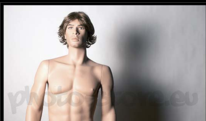
Svícení hlavním světlem v úhlu 35° diffuser ve vzdálenosti 20 cm od reflektoru