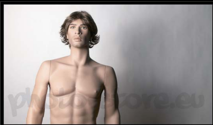
Svícení hlavním světlem v úhlu 35° diffuser ve vzdálenosti 40 cm od reflektoru