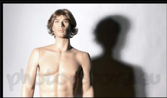
Svícení hlavním světlem v úhlu 35° 100% druhé světlo v úhlu ca 30° 50%