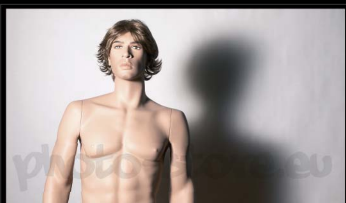
Svícení hlavním světlem v úhlu 35° diffuser ve vzdálenosti 10 cm od reflektoru