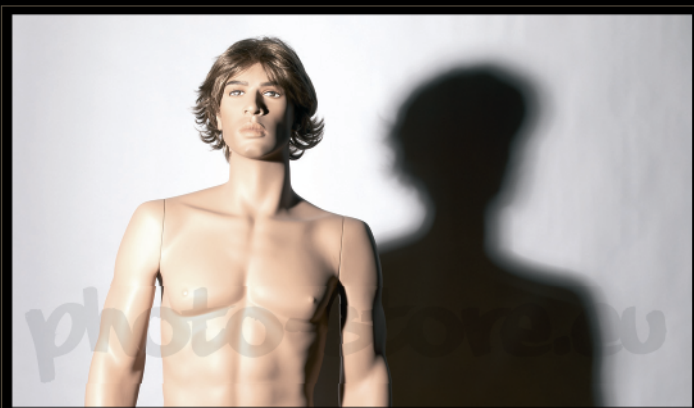
Svícení hlavním světlem v úhlu 35° reflektor s řízeným světlem pomocí klapek