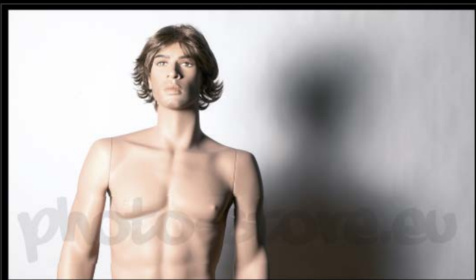
Svícení hlavním světlem v úhlu 35° za pomoci bílého průsvitného deštníku